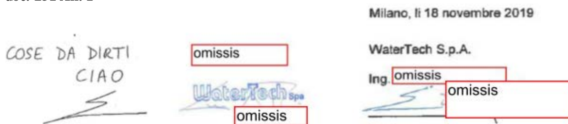
Figura 1: Confronto tra sigla a pag. 14 doc. 248 e firma legenda All. 1 doc. 405 o Procura doc. 251 All. 1

72. Nella memoria finale, WaterTech non ha contestato tali conclusioni 66 .